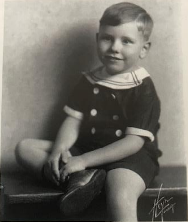
WARREN LIKED TO COUNT, be it bottle caps or coins.

ry Club neighborhood, Warren Buffett would hide room, tucking them into books, alongside the walls is